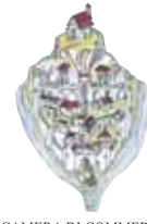
CAMERA DI COMMERCIO INDUSTRIA ARTIGIANATO E AGRICOLTURA di TERAMO